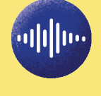
විද්‍යාලීනව පරීක්ෂණය කිරීමේදී