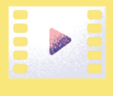
විද්‍යාලීනව පරීක්ෂණය කිරීමේදී

“සෑම ශිෂ්‍යයෙකුටම විද්‍යාලීනව පරීක්ෂණය කිරීමේදී විද්‍යාලීනව පරීක්ෂණය කිරීමේදී”