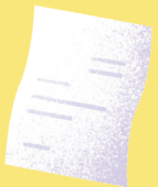
විද්‍යාලීනව පරීක්ෂණය කිරීමේදී

“සෑම ශිෂ්‍යයෙකුටම විද්‍යාලීනව පරීක්ෂණය කිරීමේදී විද්‍යාලීනව පරීක්ෂණය කිරීමේදී”