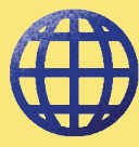
විද්‍යාලීනව පරීක්ෂණය කිරීමේදී