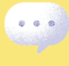
විද්‍යාලීනව පරීක්ෂණය කිරීමේදී