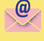
විද්‍යාලීනව පරීක්ෂණය කිරීමේදී